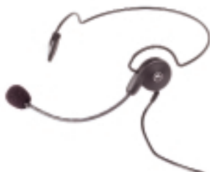
RLN5411 – Auriculares ultraligeros con sujeción trasera

Diseñada para pequeños y medianos almacenes, agricultura, seguridad, pequeña industria y empresas de servicios, la radio de cuatro canales CP040 requiere una mínima capacitación para su uso y mantiene interconectados a los miembros de un equipo sin que se distraigan con funciones complicadas. Los encargados pueden monitorizar todo el tráfico de voz y enviar un mensaje a todo el equipo en cuestión de segundos, independientemente del tamaño que tenga.