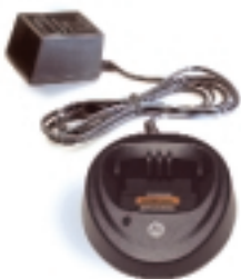
WPLN4139 – Cargador rápido de sobremesa (Europa) WPLN4140 – Cargador rápido de sobremesa (Reino Unido)